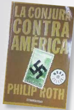
Título: La conjura contra América. Editorial: De Bolsillo. Autor: Philip Roth. Fecha: 2007.

Lindbergh aprovechó su popularidad para evitar la injerencia americana en la Segunda Guerra Mundial y atacar a la comunidad judía como responsable del desastre europeo, con el objetivo de unirse a las potencias de El Eje. La brillantez de la prosa de Roth recrea un escenario terrible en que los guetos de Nueva York recuerdan la historia más triste de Polonia. ♦