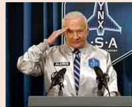
Buzz Aldrin ha dado su apoyo al proyecto.