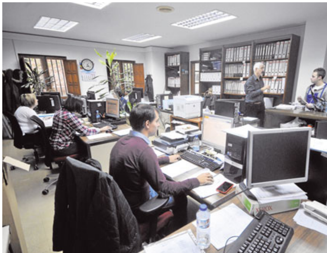
Trabajadores del servicio de becas de la Universidad de Salamanca.